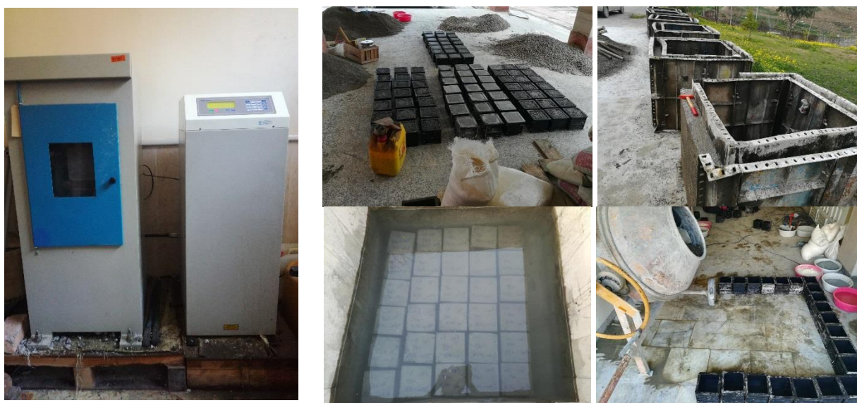
شکل ۱- مخازن عمل‌آوری، تجهیزات و مصالح مورد استفاده و آزمون‌های بتنی ساخته شده

در پژوهش حاضر با در نظر گرفتن ۵۴ عدد آزمون بتنی برای انتخاب طرح اختلاط مناسب و ۳۶۰ عدد آزمون برای آزمایش نهایی، مجموعاً ۴۱۴ مکعب بتنی ساخته شد. نمونه‌های آزمایشگاهی پس از ساخته شدن به مدت ۲۴ ساعت درون قالب در محیط آزمایشگاه (دمای 20 \pm 4 درجه سلسیوس) نگهداری شدند. سپس قالب‌ها باز شده و عملیات عمل‌آوری آغاز گردید [۱۱ و ۳۰]. به منظور شبیه‌سازی کامل تاثیر تیمارهای کیفیت آب بر مقاومت فشاری، عمل‌آوری مکعب‌های ساخته شده با آب اختلاط صورت گرفت. برای این منظور سه حوضچه بتنی جداگانه با ابعاد 1 \times 1 \times 1 متر ساخته شد و هر یک از حوضچه با یکی از انواع آب اختلاط بتن پر شد. در طول مدت